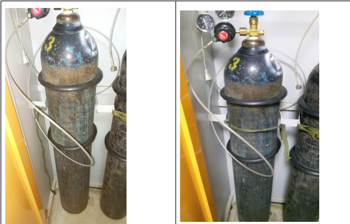
图 1. 格致楼 1005，一个氮气瓶未固定，检查组进行了现场固定处置。