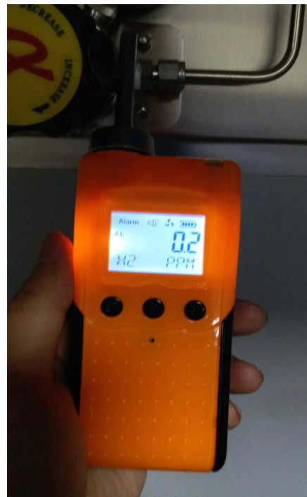
图 3. 格致楼 1004，用氢气检测仪检测到气瓶和减压阀连接处有轻微漏气情况，漏气量为 0.2ppm。