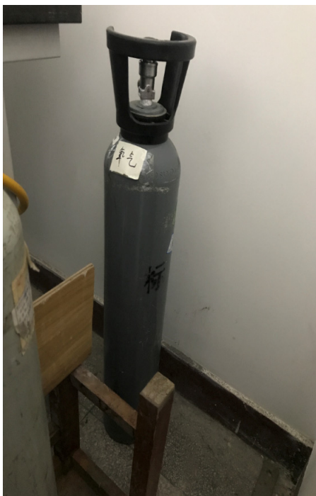
图 2. 格致楼 304，一个小氧气瓶未按要求固定。