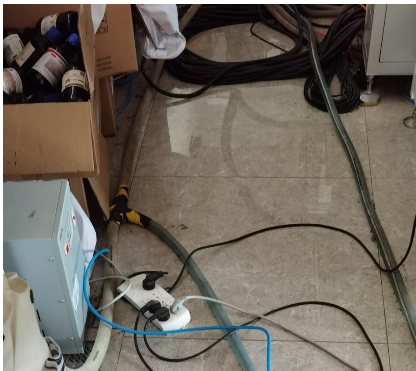
理工楼 1322：配电柜门被堵、卫生杂乱